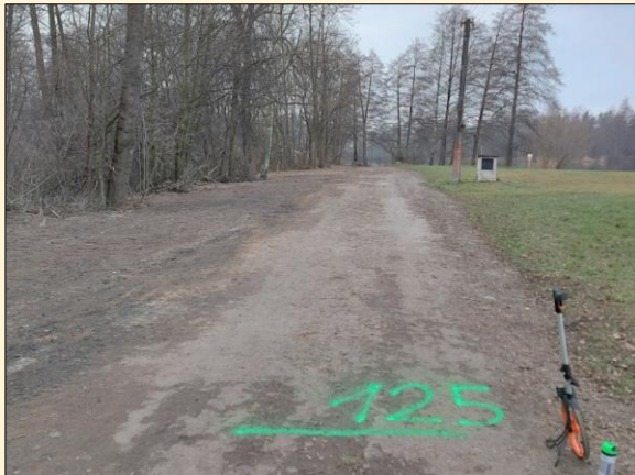
Projekt č. 7782