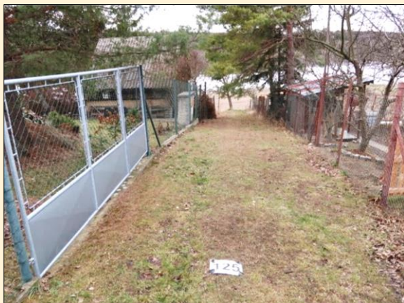
Stav před realizací projektu