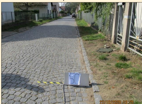
Fotodokumentace původního stavu