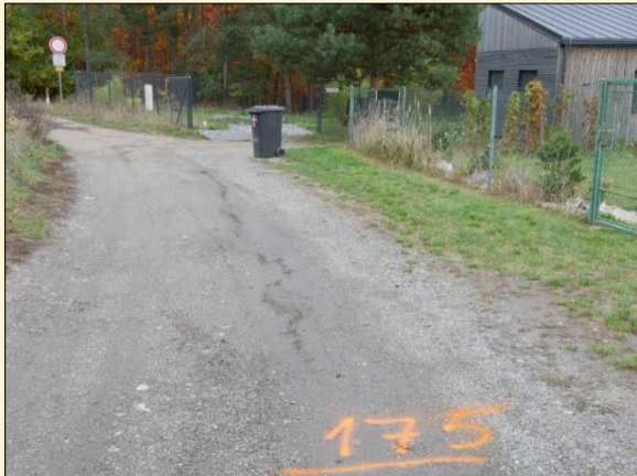
Projekt č. 8304