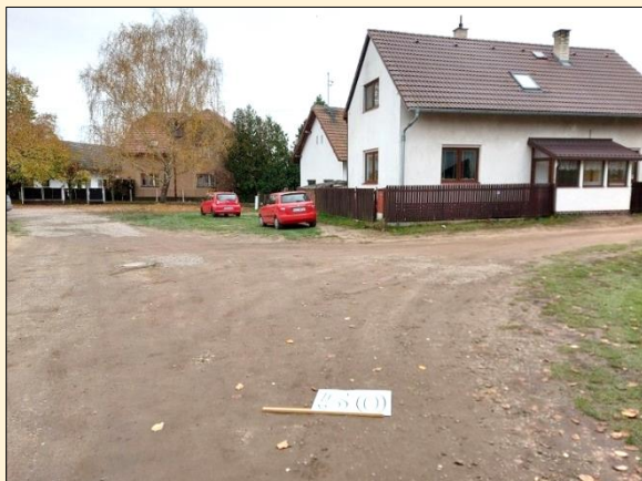
Stav před realizací projektu