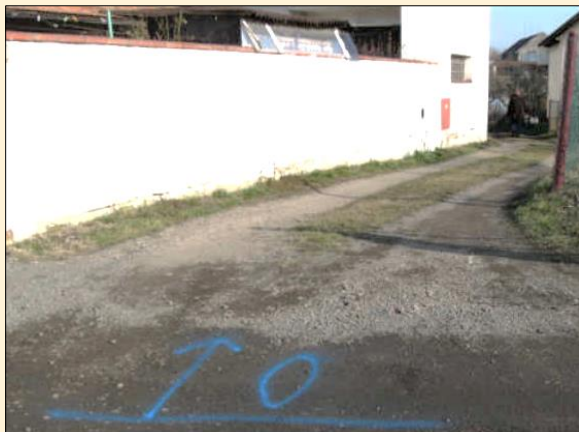
Stav před realizací projektu