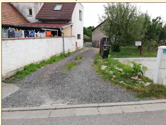
Stav v době kontroly NKÚ

Zdroj: žádost o dotaci, podklady pro závěrečné vyhodnocení akce.