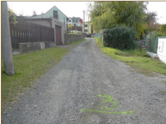
Projekt č. 8268