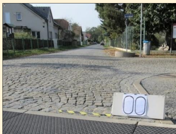
Zdroj: žádost o poskytnutí dotace (stav před realizací projektu).

→ Podmínky čerpání podpory byly nejasné, postup příjemců podpory byl nejednotný.