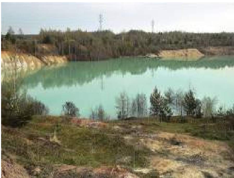
Skládka nebezpečných odpadů (laguna)

Hlavní cíle odpadového hospodářství Slovenské republiky byly stanoveny v Programu odpadového hospodářství Slovenské republiky (POH SR) do roku 2005, který schválila vláda Slovenské republiky dne 27. 2. 2002. POH SR byl zpracován v návaznosti na zákon o odpadech č. 223/2001 Z. z. (zákon o odpadech), respektoval v té době probíhající proces transpozice právních předpisů EU a obsahoval zejména charakteristiku aktuálního stavu odpadového hospodářství, strategii jeho řízení, závaznou a směrnou část a rozpočet.